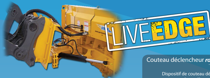
Couteau déclencheur roulement DOUX exclusivité de Métal Pless

Dispositif de couteau déclencheur qui empêche le chasse-neige de lever lorsqu'il y a collision avec un obstacle quelconque